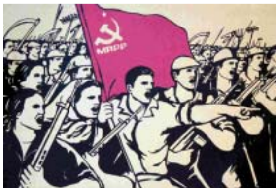
Fig 11 - Estratos de cartazes do MRPP que são paradigmáticos da representação iconográfica da emotividade. No caso específico do MRPP, a emoção assume-se como uma representação estilizada. É uma emoção institucionalmente determinada, estando patente na expressão facial (com especial destaque para a boca aberta - como se se pretendesse representar iconograficamente o grito ou, se se quiser, o slogan ) e para a ênfase dramática do gesto e da pose. Há quem afirme que é precisamente nesta preferência institucional pela dramatização teatral do gesto e da pose que radica a influência do cartaz chinês no cartaz do MRPP.