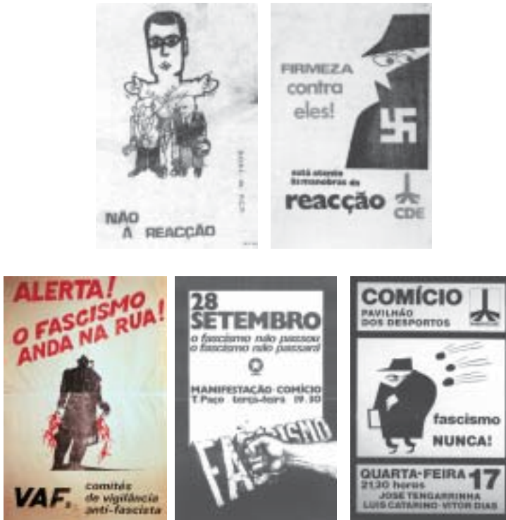
Fig. 4 - Da esquerda para a direita e de cima para baixo: cartaz C - 'Não à reacção' - DORL do PCP; cartaz D - 'Firmeza Contra Eles!' - MDP-CDE; cartaz E - 'Alerta! O Fascismo Anda na Rua?' - VAF; cartaz F - '28 de Setembro. O Fascismo Não Passou. O Fascismo Não Passará' - GDUP; cartaz G - 'Fascismo Nunca!' - MDP-CDE.