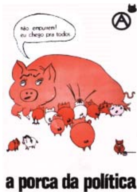
Fig. 3 - A boca canina que representa o inimigo político explorador pode, igualmente, ser representada por outros motivos. Num registo cómico, destaca-se o cartaz do movimento anarquista, fortemente inspirado nos cartoons de Raphael Bordallo Pinheiro.