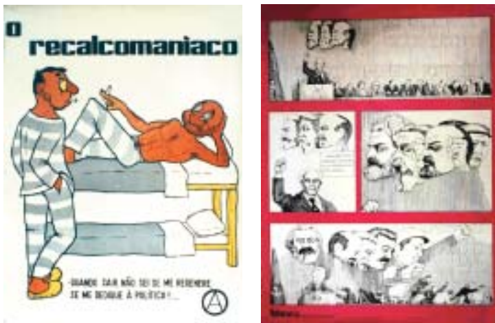
Fig. 12 - Na anedota a imagem adquire uma importância incontornável. O cartaz-banda desenhada editado pela revista 'Spartacus' ridiculariza a fidelidade de Álvaro Cunhal (numa perspectiva restrita) e do PCP (numa perspectiva lata) aos reais valores do marxismo leninismo. O 'gag' reporta-se ao VIIº Congresso (Extraordinário) do PCP de 20 de Outubro de 1974 e ilustra a reacção de Marx, Engels, Lénine, Stalin e Mao Tsé Tung à proposta de Álvaro Cunhal para suprimir algumas expressões como é o caso da 'ditadura do proletariado'.