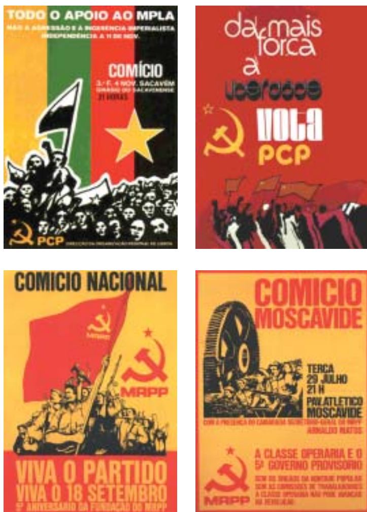
Fig. 7 - A nível iconográfico, a retórica do ‘meeting’ e a retórica da ‘guerra’, reflectem-se também na forma como a comunidade política é retratada. No âmbito da retórica do ‘meeting’, recorre-se igualmente, à representação de toda uma cinética do contacto físico: o braço aberto que abraça, a mão que aperta a outra mão, o braço entrelaçado, etc..