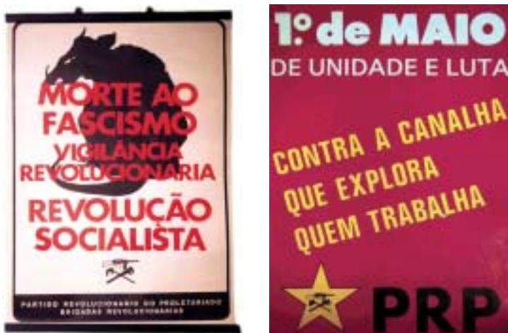
Fig. 10 - A invectiva a nível verbal e iconográfico. Saliento que a silhueta do rato, entendida como metáfora iconográfica do fascismo, é um motivo copiado de uma serigrafia de um cartaz francês relativo aos acontecimentos de Maio de 1968 ( Vermine Fasciste. Action Civique ). Este cartaz é duplamente relevante, porque não só é demonstrativo da possibilidade de se desenvolverem invectivas a nível iconográfico, como também das influências estéticas subjacentes à produção cartazística do pós 25 de Abril.

GASQUET, Vasco – Les 500 Affiches du Mai de 68 . Paris, Balland, 1979.