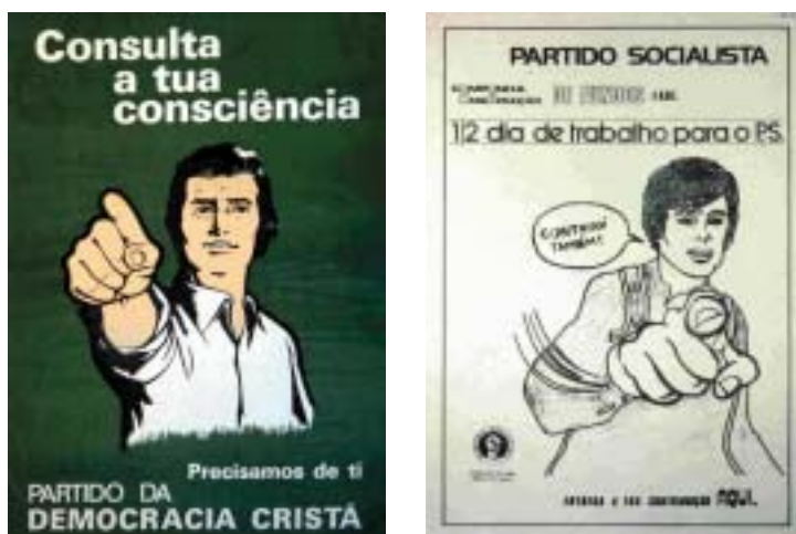
Fig. 9 - Variações, mas numa perspectiva político-partidária, em torno do cartaz de recrutamento militar da autoria de Alfred Leet – “Your Country Needs You”.