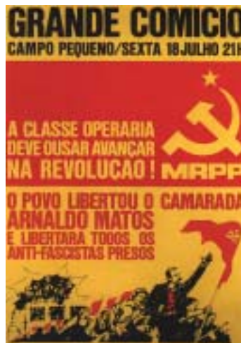
Fig. 6 - Os diferentes sentidos de uma bandeira. Nos dois cartazes de cima: a bandeira, enquanto adereço de afirmação político-partidária; nos cartazes de baixo: a bandeira, enquanto estandarte.