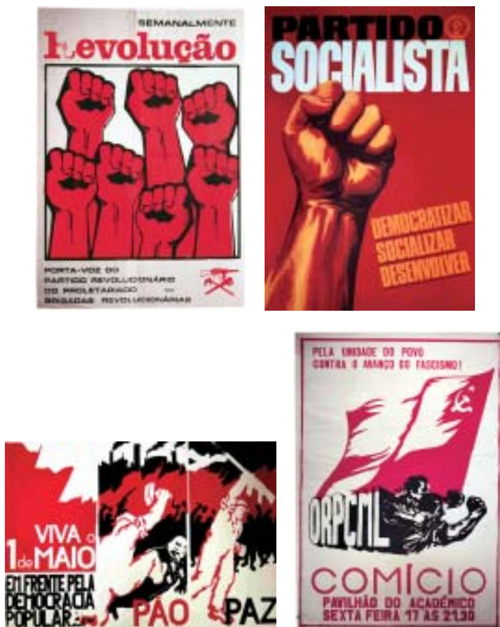
Fig. 8 - As variações da representação do gesto, conforme o discurso transmitido pelas imagens adquire matizes agonísticas.