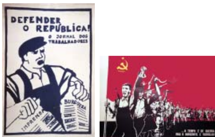
Fig. 1 - A boca aberta (correlacionada com a representação de outros gestos e até mesmo adereços), como elemento iconográfico de uma retórica política de tipo ‘marcial’.