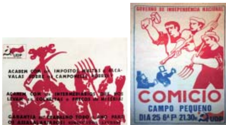
Fig. 5 - Exemplos da inversão do sentido metonímico dos adereços. Num caso, os instrumentos de trabalho são metonímias do trabalhador concebido como um actor político-partidário; no outro, já não são enunciados como ferramentas, mas, sim, como armas, adereços metonímicos do soldado-trabalhador integrado numa guerra de índole político-partidária.